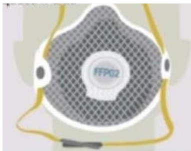
FFP2 - FFP3

Sono destinate a personale sanitario: Medici, Infermieri, Soccorritori, Forze dell'Ordine, ecc